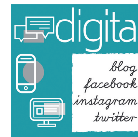
Soziale Medien, Grafik. belladonna, Kultur, Bildung und Wirtschaft für Frauen e.V.