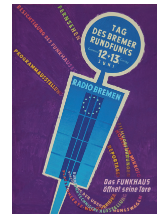
Plakat, 1954. Künstler: Will Haunschild.

Zu allen Veranstaltungen Eintritt frei Änderungen und Irrtümer vorbehalten Siehe auch Tagespresse und www.bremer-archive.de