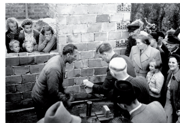
Eine Metallrolle wird eingemauert, Alfred-Henke-Str. 1, 1952. Arbeitskreis Arster Geschichte(n)

Mittwoch, 11. März, 14–17 Uhr Leben und Handwerk in Arsten mit Sonderausstellung Spielsachen aus einem Jahrhundert Dat Lüttje Museum, In der Tränke 12, 28279 Bremen