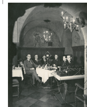
Rundfunkübertragung aus dem Ratskeller Ende der 1920er Jahre.