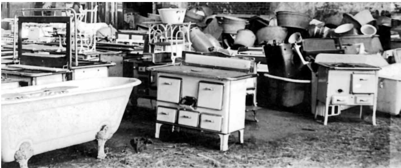
Bildnachweise: Sammellager für jüdischen Besitz, 1943, Quelle: Stadtarchiv Oberhausen.

Die Beraubung der jüdischen Bevölkerung war ein einträgliches Geschäft. Der Staat, viele Unternehmen und Privatleute profitierten von der »Arisierung« jüdischen Besitzes im Nationalsozialismus – und tun es zum Teil, als Erben, bis heute.